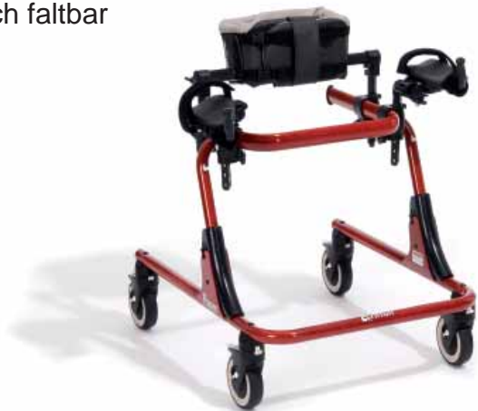
Maße - Grundmodell