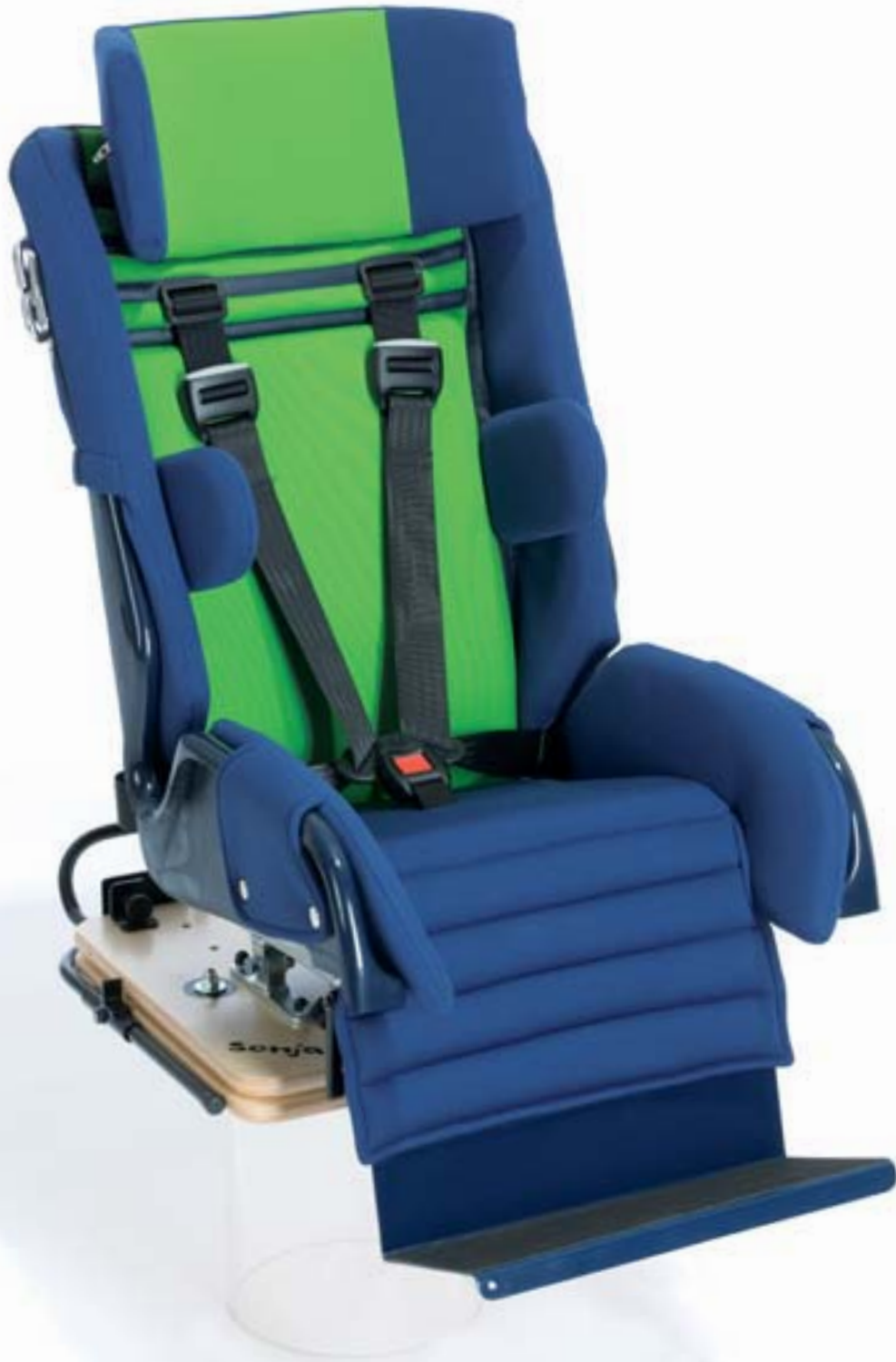
Abb. Grundmodell SONJA Größe 2 zusätzlich mit Schwenkvorrichtung, Fußbank, Abduktionskeil, Kopfstütze und Hosenträgergurt