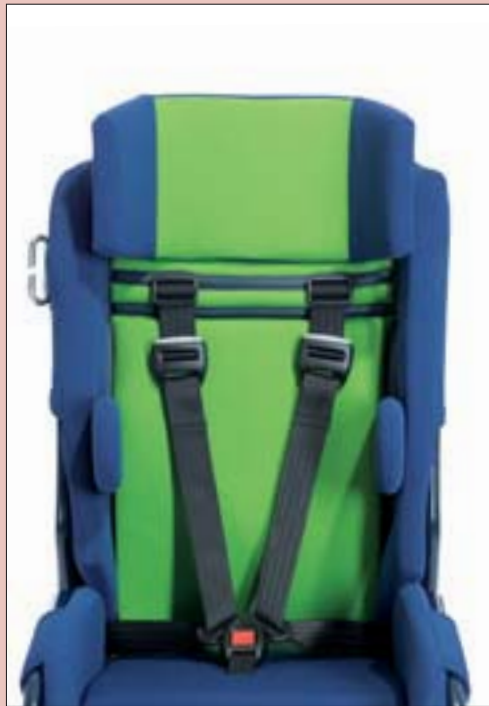
Höhenverstellbare Kopfstütze mit guter Seitenführung