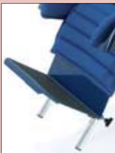
Die Fußbank ist in Höhe und Kniewinkel einstellbar