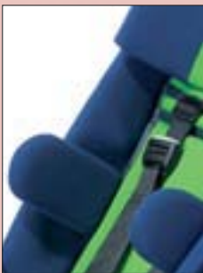
Skolioseplatten zur Unterstützung der Rumpfkontrolle, Anbau nach Maß