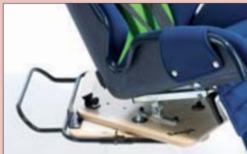
SONJA ist optional mit einer Schwenkvorrichtung erhältlich