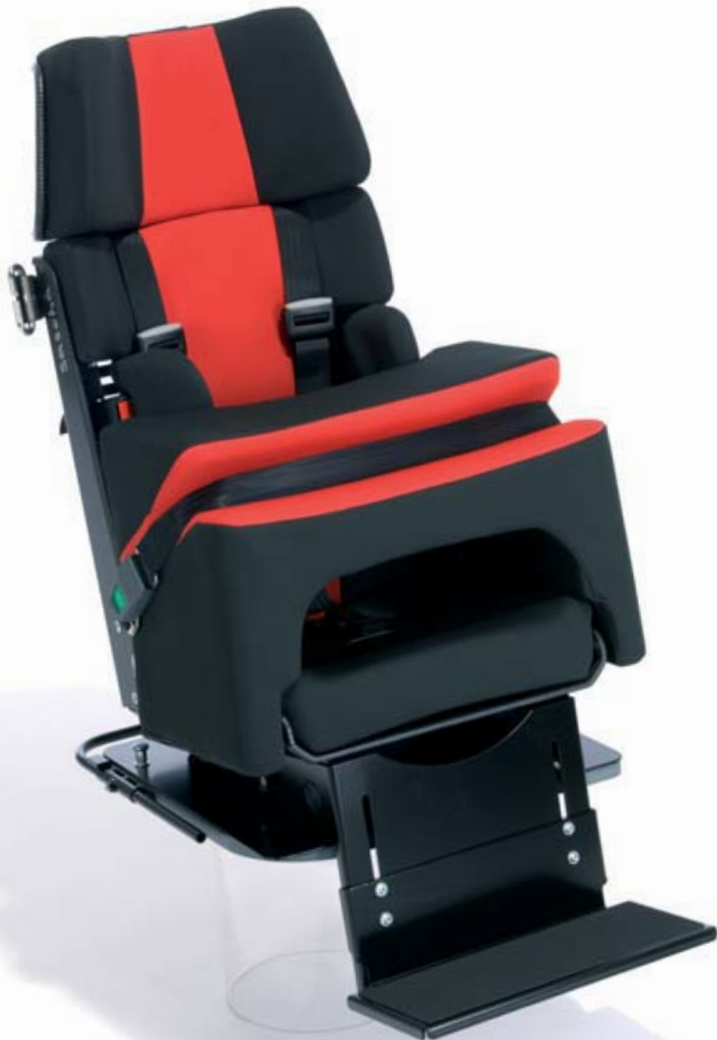
Abb. Grundmodell SASCHA Größe 2a zusätzlich mit Schwenkvorrichtung, Fußbank und Seitenführungs- und Rumpfhaltelaster

das schwenkbare Pkw-Sitz- und Rückhaltesystem