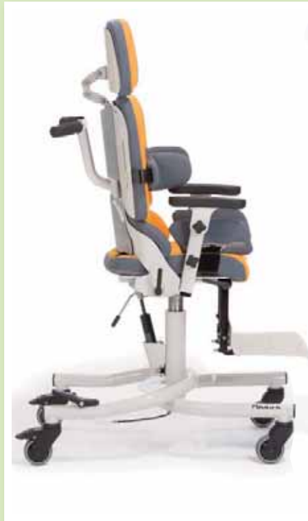
Sitzkantelung per Gasdruckfeder