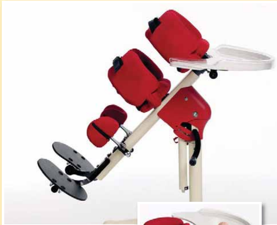
Kantelung zur Bauchlage mittels Gasdruckfeder