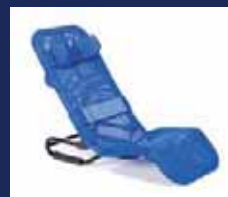
BASTI ..... Seite 20-21