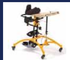
TIM ..... Seite 16-17