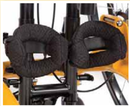
Dreidimensional einstellbare Kniepelotten