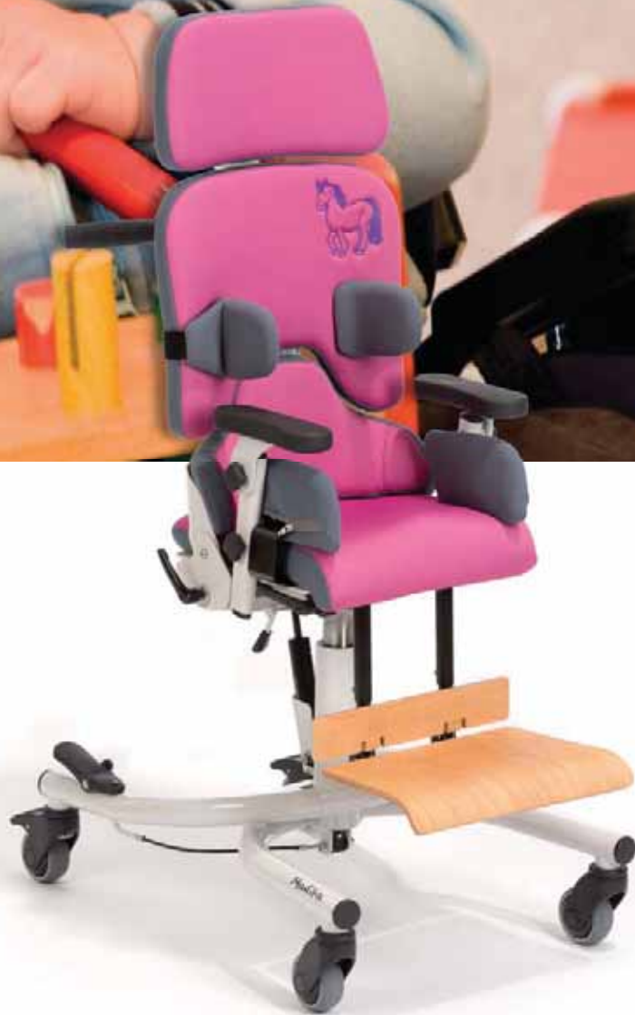
Abb. Grundmodell MADITA Gr.1 zusätzlich mit Kopfstütze, Seitenpelotten und Oberschenkelführung