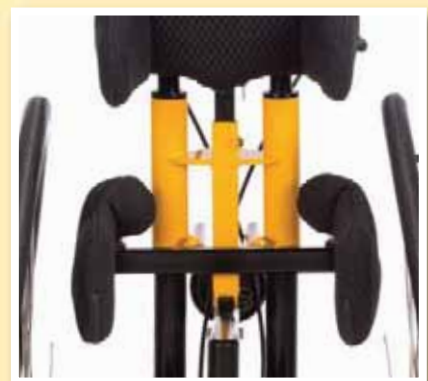
Kombinierte Spinen- und Beckenpelotten

lichen im Rumpf und den Extremitäten möglich. Mittels einer Hand-Kurbel ist die Gesäßpelotte in der Tiefe zu verstellen, um so einer vorhandenen Knie- oder Hüftbeugekontraktur entgegen zu wirken. Die kombinierte Spinen- und Beckenpelotte positioniert in Wechselwirkung mit der Gesäßpelotte das Becken und fördert dadurch die Aktivität im Rumpf und in den oberen Extremitäten.