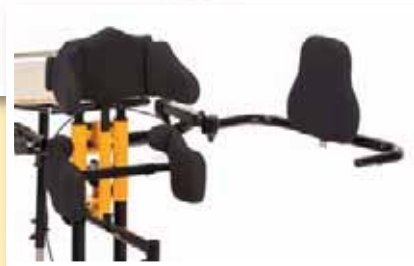
Rückenpelotte, montiert am Schwenkarm