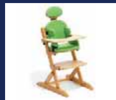
SMILLA ..... Seite 22-23