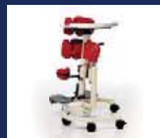
TONI ..... Seite 18-19