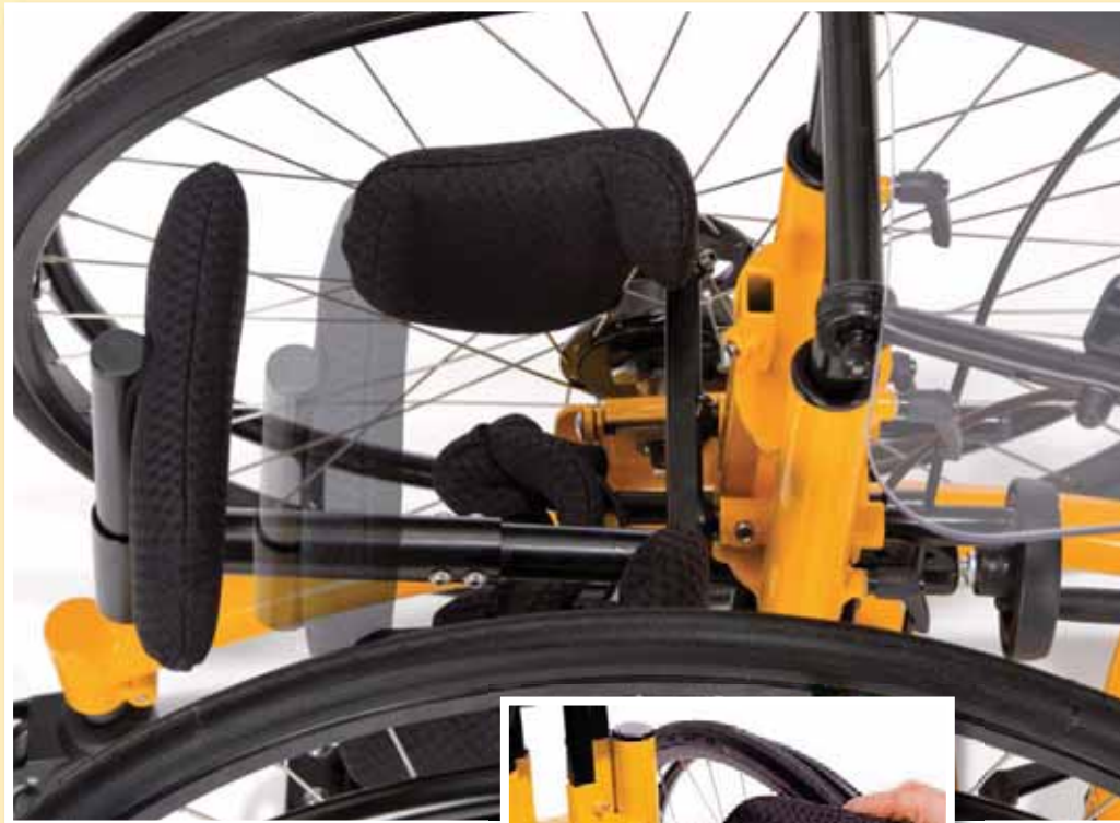
Die Gesäßpelotte ist per Handkurbel in der Tiefe verstellbar