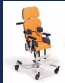
MADITA und MADITA-FUN ..... Seite 4-11