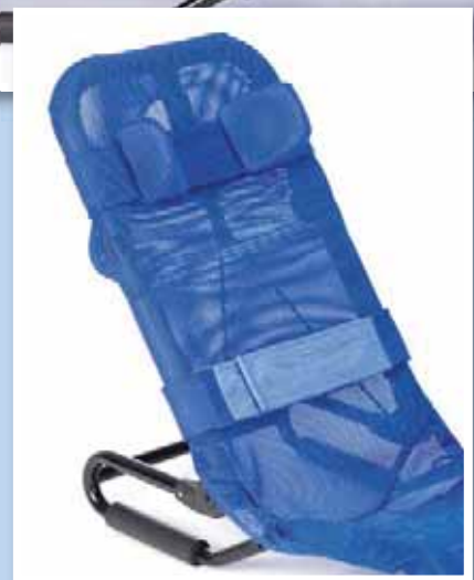
Kopfstütze und Brustgurt für zusätzlichen Halt