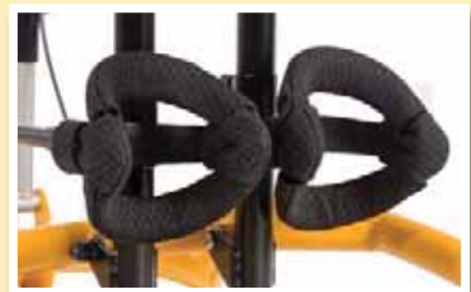
Dreidimensional einstellbare Kniepelotten

Mittels einer Hand-Kurbel ist die Gesäßpelotte horizontal zu verstellen, um so einer vorhandenen Knie- oder Hüftbeugekontraktur entgegen zu wirken. Die kombinierte Spinen- und Beckenpelotte positioniert in Wechselwirkung mit der Gesäßpelotte das Becken und fördert dadurch die Aktivität im Rumpf und in den oberen Extremitäten. Die Kniepelotten bieten in jeder gewünschten Kniegelenksposition eine größtmögliche und damit druckreduzierende Auflagefläche. Gleichzeitig bleibt die Kniescheibe frei und damit ohne direkte Druckbelastung.