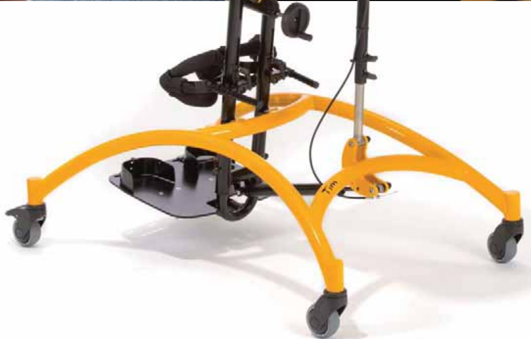
Abb. Grundmodell TIM Größe 2 zusätzlich mit am Schwenkarm montierter Rückenpelotte und Kniepelotten mit einstellbaren Anlagebügeln