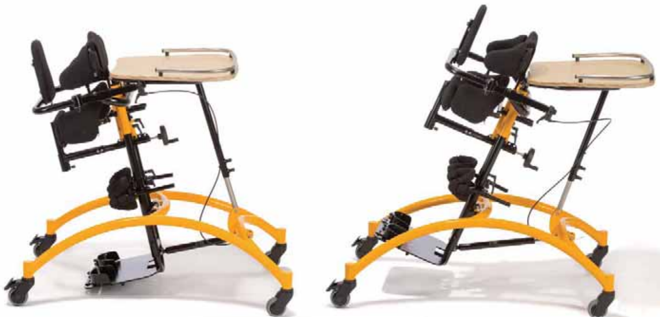
Die Mittelsäule ist von (-)15° bis 45° mechanisch verstellbar