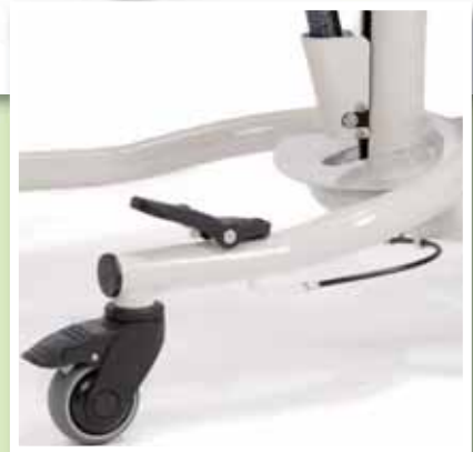
Sitzhöhenverstellung per Gasdruckfeder