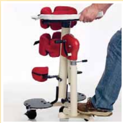
360° Drehfunktion um die Hauptsäule