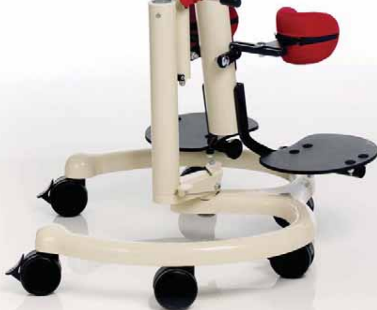
Abb. Grundmodell TONI Größe 2 zusätzlich mit Knieplotten, Becken- und Rumpfpelotte und Therapietisch