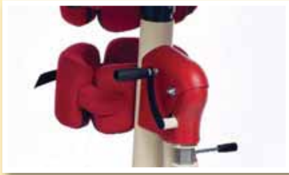
Höhenverstellung mittels Kurbel, auch während der Nutzung zu bedienen