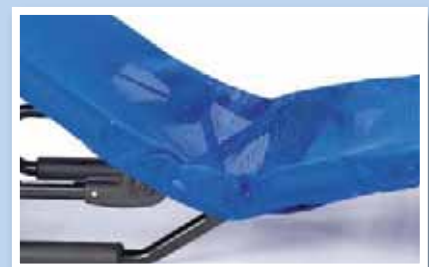
Optionaler Bezug mit integrierter Beckenmulde

Die vielfältige Bade- und Duschieliege BASTI, erhältlich in vier Größen, bietet Sicherheit und Spaß beim Baden und unterstützt Kinder und Jugendliche, die nicht frei sitzen können. In Kombination mit einem fahrbaren Untergestell kann BASTI auch als Duschieliege verwendet werden.