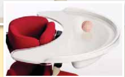
Tisch mit großer Therapiemulde