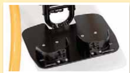
Die Fußplatte bietet vielfältige Einstellmöglichkeiten zur individuellen Anpassung