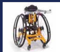
TODD ..... Seite 12-15