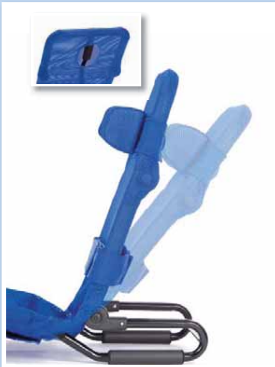
Zentrale Verstellung des Rückenwinkels