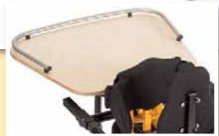
Holztherapietisch mit Rand

Der Stehtrainer TIM ist in 3 Größen erhältlich und ermöglicht die achsengerechte Vertikalisierung von Kindern und Jugendlichen.