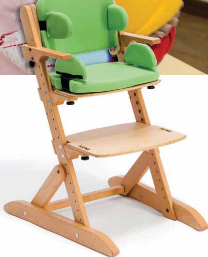
Abb. Grundmodell SMILLA zusätzlich mit Kopfstütze, Seiten- und Hüftpelotten