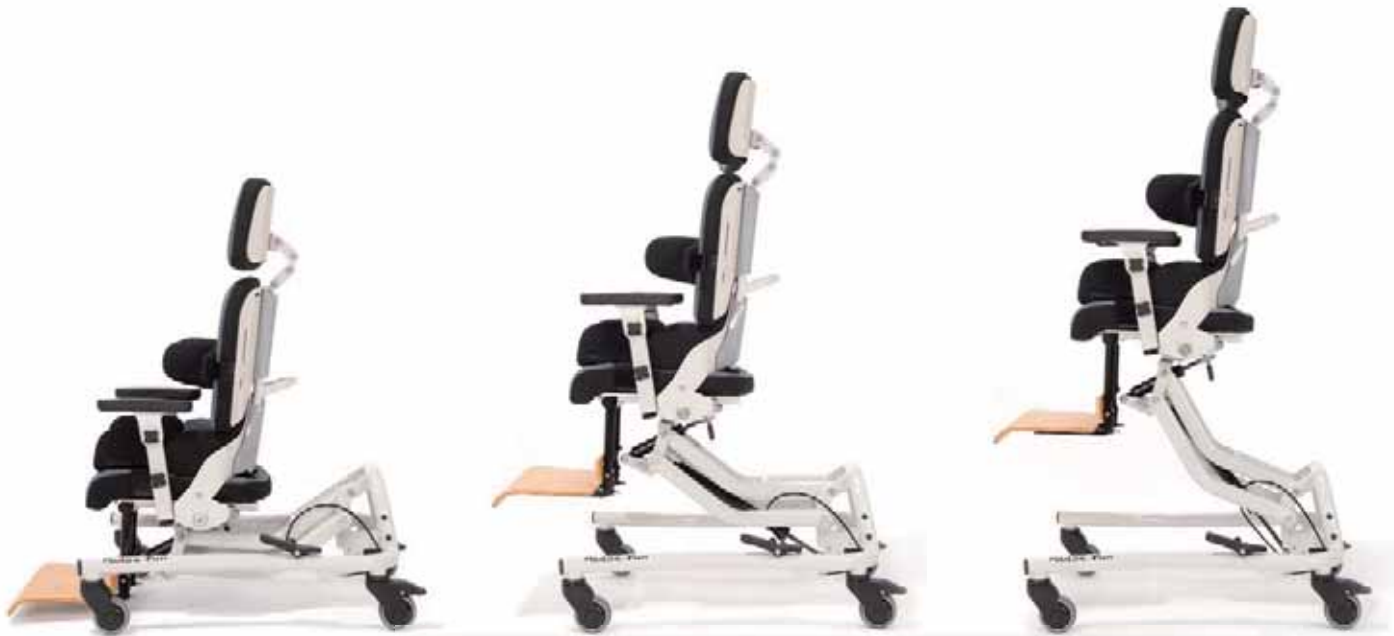
Sitzhöhereinstellung bis auf Spielebene