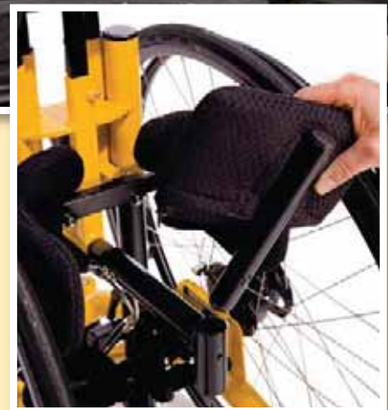
Gesäßpelotte wird beim Transfer eingesetzt und ist selbstsichernd

Der fahrbare Stehtrainer TODD ist in 4 Größen erhältlich und bietet maximale Mobilität im Stehen. Über zwei große Antriebsräder ist es dem Kind oder Jugendlichen möglich, selbständig und selbstbestimmt in die gewünschte Räumlichkeit zu wechseln. Darüber hinaus wird beim TODD, neben dem medizinisch-therapeutischen Nutzen eines stationären Stehtrainers, im besonderen Maße die Rumpf- und Armmuskulatur gefördert.