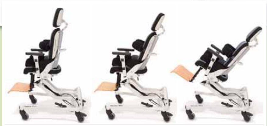
Sitzkanteler per Gasdruckfeder

MADITA-FUN erweitert den Nutzen des Therapiestuhls MADITA um die Sitzhöhereinstellung von jeder gängigen Tischhöhe bis zum Fußboden.